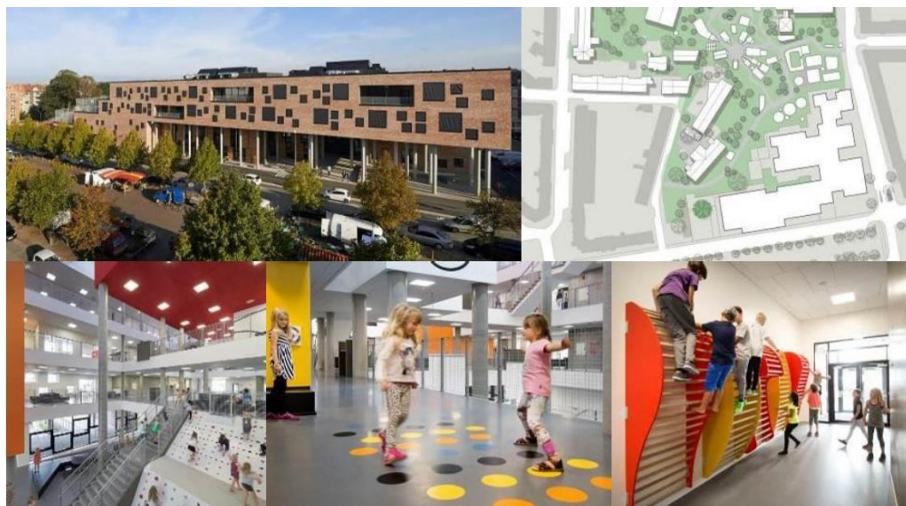
Фиг. 2. Frederiksbjerg School, Aarhus, Denmark. Арх. Henning Larsen Architects, GPP Architects.

Вторият пример за училищна сграда с атриумни общи пространства е „Frederiksbjerg School“ в Орхус (фиг. 2). Построена е през 2016 г., простира се на площ от 15000 m 2 и е с капацитет 900 ученици.