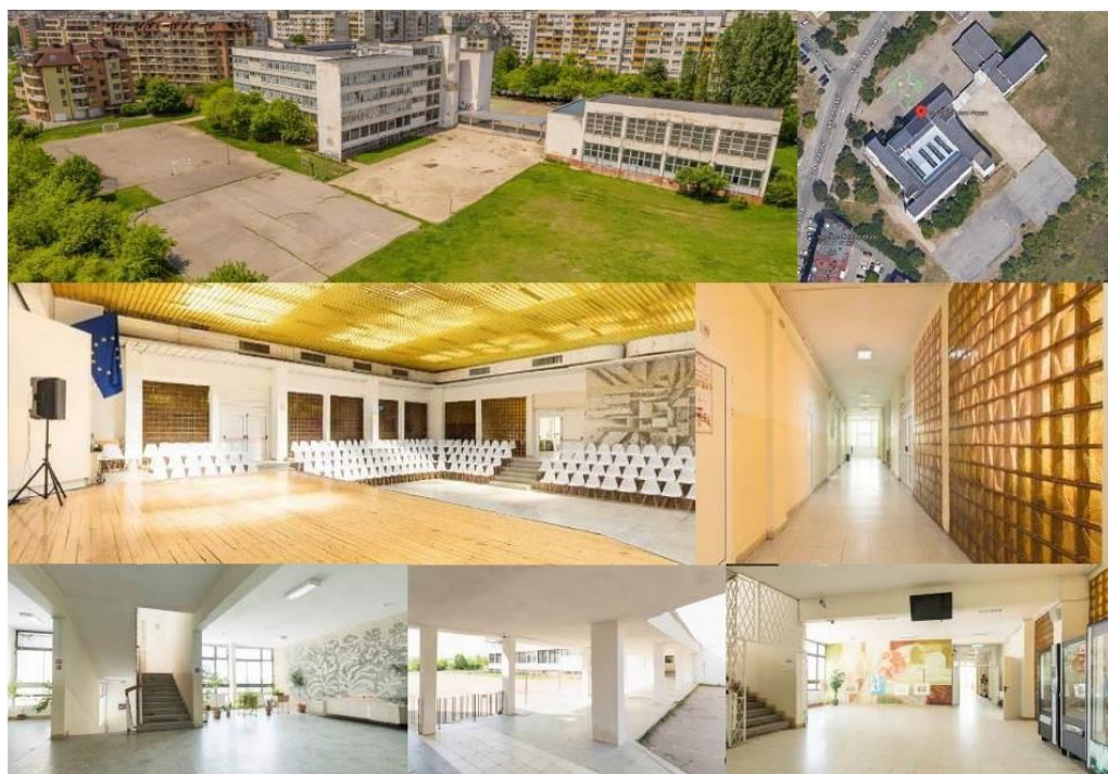
Фиг. 10. 145 ОУ „Симеон Радев“, София, България.

Четири етажа на училището по отношение на общите си части (преддверия и коридори) са просторни, добре осветени, но без визуална връзка с класните стаи, лишени от мебелировка, осигуряваща извънкласни занимания и почивка.