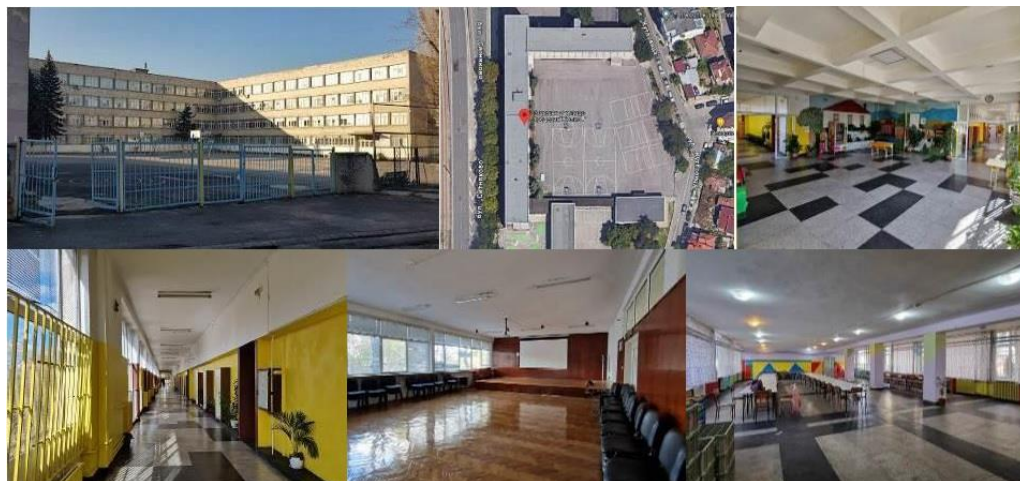
Фиг. 7. 23 СУ „Фредерик Жолио-Кюри“, София, България.

България и в частност големите областни градове разполагат с голям застаряващ училищен сграден фонд, като последните построени образователни здания са от 80-те години на XX век. Общите пространства в повечето от тях са празни помещения (фиг. 7) или коридорни структури (фиг. 7), които помещават единствено шкафове за ученически пособия, а многофункционални площи (фиг. 7) въобще липсват или са с голяма заетост. Учители и директори успяват да подобрят средата с поставянето на растителност или мека мебел, но задължително съобразена със съществуващите морално остарели противопожарни норми [4]. Столовите са неприветливи (фиг. 7), често слабо осветени, разположени в приземни или полуподземни етажи. Дворовете са изцяло асфалтирани, без тревна или дървесна растителност, както и без градинска и паркова мебел, необходима за отдых и рекреация (фиг. 7). Залите за спорт са едноетажни постройки, често с недостатъчен капацитет, остаряло оборудване и без визуална връзка с основните учебни сгради. Повечето от помещенията за физическа активност имат потенциал за надстрояване и разширение, но поради недостатъчно държавно финансиране подобни реконструкции са невъзможни.