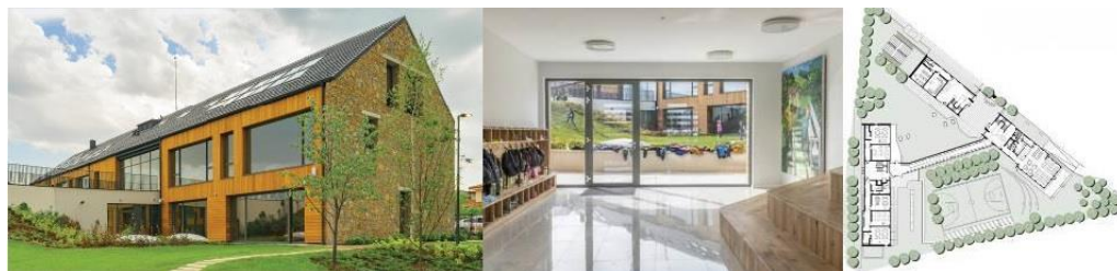
Фиг. 9. Училище „Дени Дидро“, Баня, България.

На фона на бавно адаптиращата се към световните практики българска училищна архитектура съществуват и примери на съвременни сгради на образованието, които успяват да съчетаят идеите за многофункционалност на пространствата, устойчивост, технологичен прогрес, връзка с природната среда и благосъстояние на учениците. На фиг. 9 е илюстрирана подобна сграда в град Баня.