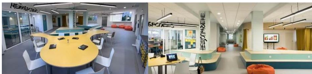
Фиг. 8. 90 СУ „Ген. Хосе де Сан Мартин“, София, България.