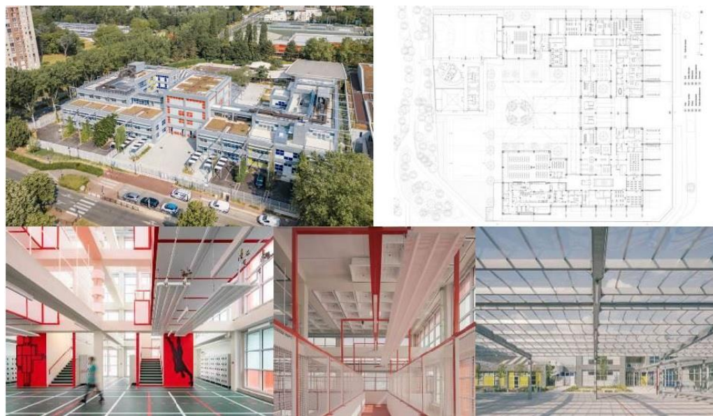
Фиг. 5. Anne Frank Middle School Renovation, Antony, France. Арх. MARS Architectes.

Третият пример за реставрирана и модернизирани сграда е училище, своеобразна контекстуална актуализация на наследството от 80-те години на XX век, а именно Anne Frank Middle School (фиг. 5) в Антони. Площта му е 7572 m 2 и е построено през 2023 г.