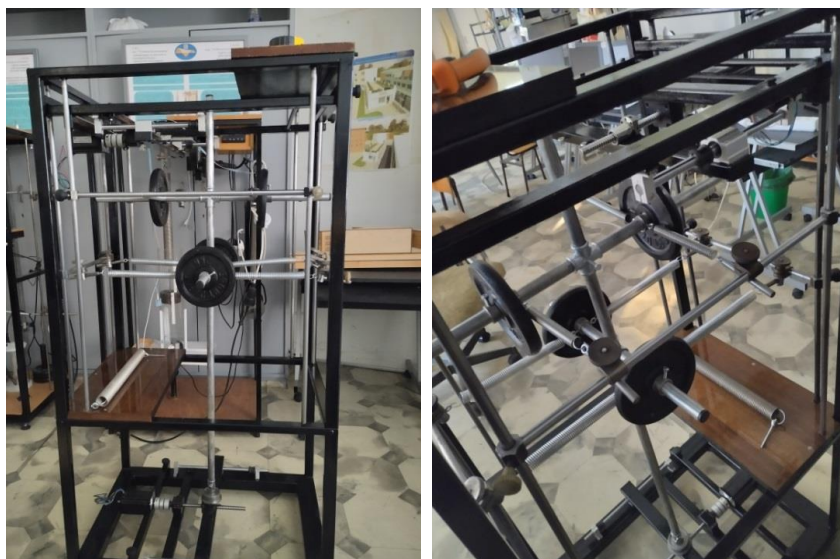
Фиг. 1. Изпълнен стенд

Стендът, използван за опита, е проектиран и изпълнен съгласно заложените предварително предпоставки [5]. По-важните от тях включват: простота (важна както за изпълнението, така и за възможността да се изследва задача, която е решима аналитично), възможност за модифициране и изследване на различните видове трептения, мобилност – стендът да може да се премества. Геометрията на стенда се доближава максимално до геометрията, използвана за аналитичните и числени решения на задача за изследване на трептенията на тяло с неподвижна точка [6]. Изготвеният стенд може да се види на фиг. 1.