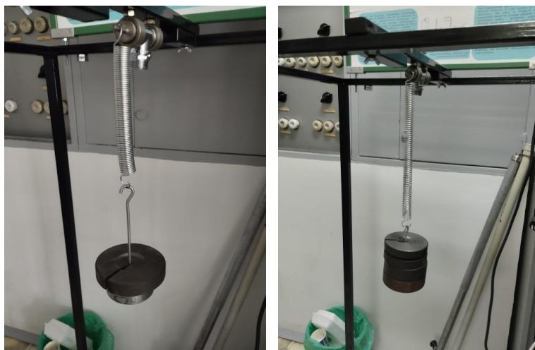
Фиг. 4. Експериментално определяне на коравина на пружина по статичен метод

Така определените коравини на пружините се използват, за да се определят аналитично собствените честоти и периоди на тялото с една неподвижна точка. Собствените честоти и периоди се определят и експериментално чрез замерване с хронометър.