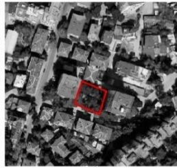
Б Размери - 20м. x 36,8м. Площ - 770 кв.м. Собственост: Общинска частна