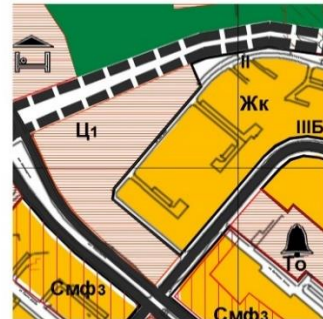
Извадка от ОУП на гр. Пловдив