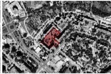
В Размери (прибл.) ~ 100м. x 100м. Площ (прибл.) ~ 9500 кв.м. Собственост: Общинска частна