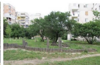
Фиг. 1. Урбанистичен контекст на трите казуса в гр. Пловдив: а) публично пространство в ЦГЧ, Капана; б) междублоково пространство в квартал със смесено застрояване в ЦГЧ; в) междублоково пространство в жк Тракия. По редове: 1) Урбанистични характеристики; 2) Предвиждания на ПУП и ОУП; 3) Извадка от КАИС; 4) Изграденост и състояние на публичните пространства – снимки