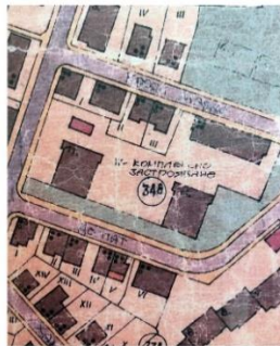
ЗРП на "Трета граска част", кв. 348, междублоково пространство