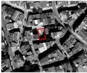
А Размери - 16x15,8м. Площ - 218 кв.м. Собственост: Общинска частна

жилищен комплекс е обособен като самостоятелна териториално-административна единица [49]. През 2016 г. в междублоковите пространства на Тракия се провеждат различни инициативи с фокус гражданско участие в рамките на One Architecture Week.