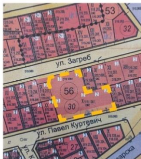
Новият ОУП на ЦГЧ предвижда застрояването на Ядрото