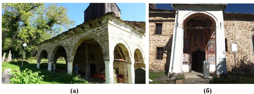
Фиг. 1. Външни метални обтегачи в църквата „Св. Николай Мирликийски“ в с. Гумощник: (а) Западна пристройка с камбанария, (б) Патронна арка

Първата фаза на проучванията беше обзорна и се основаваше на литературни данни. Бяха проучени няколко монографии за българското архитектурно наследство [1 – 5] и голям брой интернет-сайтове, които съдържат фотодокументация на сгради от нашето НКН. Беше събрана информация за повече от 40 обекта от НКН, в които са използвани метални обтегачи. Паралелно бяха проучени и чуждестранни публикации, обобщаващи натрупания опит по темата [6 – 8].