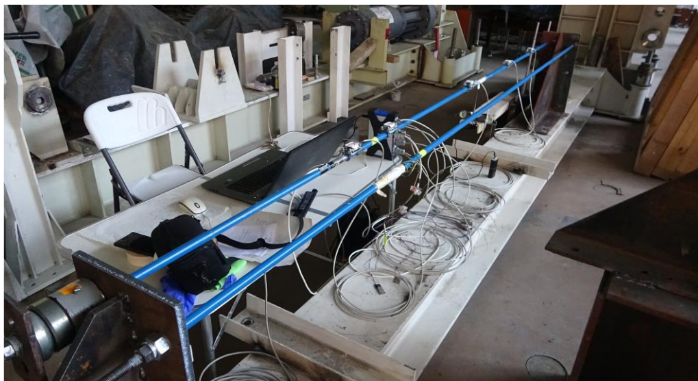
Фиг. 4. Общ вид на експерименталната постановка

Паралелно с описаните по-горе проучвания и обследвания на място са разработени числени модели на метални обтегачи, с които е изследвано изменението на честотите на собствени трептения във функция на опънните усилия/напрежения в елементите и влиянието на опорните условия. По-подробна информация за числените изследвания се съдържа в [9]. В лабораторията на катедра „Метални, дървени и пластмасови конструкции“ към Строителния факултет на УАСГ беше създадена опитна постановка за експериментални изследвания на стоманени обтегачи с цел определяне на динамичните им характеристики чрез анализ на реагирането, породено от импулсни въздействия в произволно място по дължина на обтегача (фиг. 4).