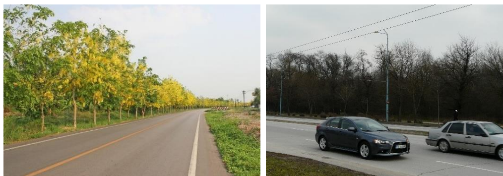
Фиг. 4. Редове от дървета, намаляващи шумовото замърсяване в градските райони [14] и личен архив Е. Иванова

Изпълнение на „зелените пояси“ по протежение на пътни артерии се прилагат от години. Акустичният ефект на тези прегради е в доста широки граници – от 3 – 4 dB до 15 dB и зависи от видовете растителност, от гъстотата и височината им и от броя редове. Обикновено се прилага комбинация от храстова и храстовидна и дървовидна растителност (фиг. 4).