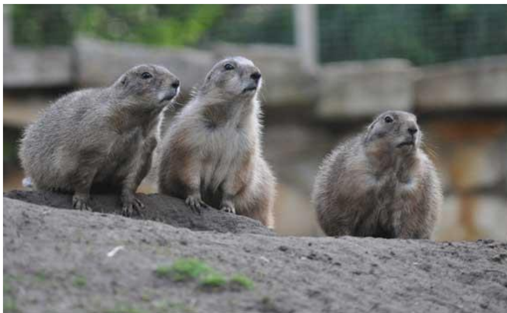
Фиг. 3. Популациите на прерийните кученца намаляват в близост до магистрали [7]