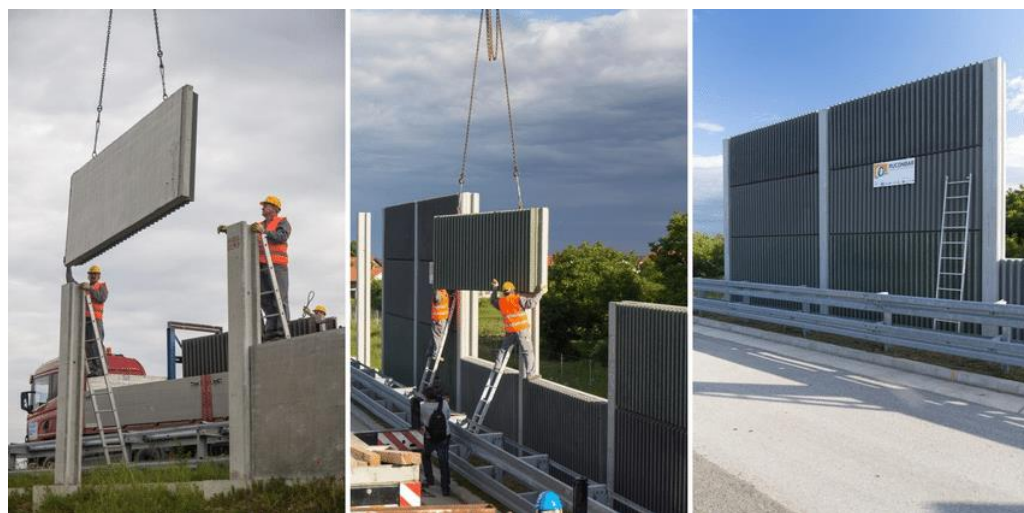
Фиг. 11. Шумозащитна преграда от рециклирани гуми [27]