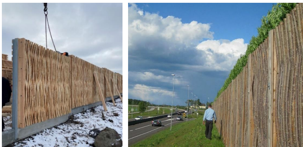
Фиг. 6. Шумозащитна стена от еко-материали с фасада от обелена върба и ламела от лиственица, построена през 2021 г. [17]