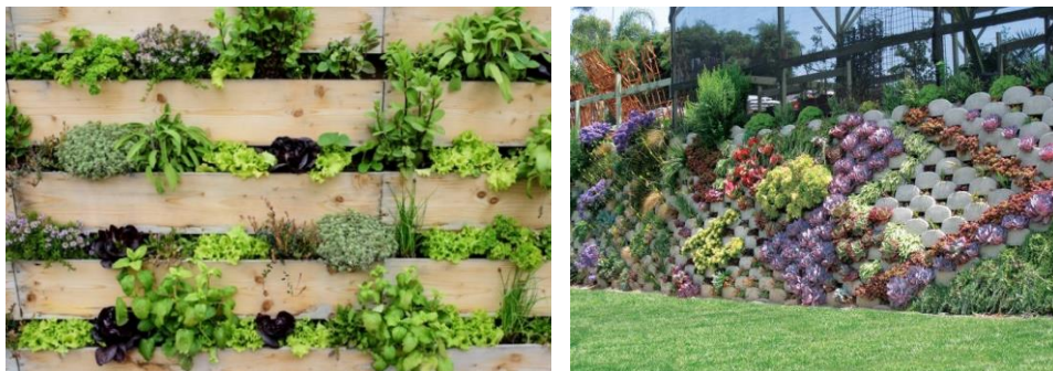
Фиг. 5. Био преграда с дървена основна конструкция [15] и Био преграда с бетонна основна конструкция [16]

Те са често срещани в практиката с наименованието „био прегради“. Тези шумозащитни съоръжения са конструкции от дърво, бетонни тела (фиг. 5) и дори керамика, оформящи специални зони на принципа на саксии, в които се засаждат растения. Вариантите за подобни шумозащитни прегради са най-разнообразни и с лекота се вписват на редица места.