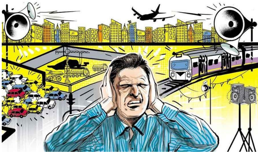
Фиг. 1. Картино изображение на шумово замърсяване, показващо тревожна опасност за здравето [4]

Той може да бъде квалифициран като напрягащ, дразнещ и неприятен. В патофизиологичен смисъл това е всеки акустичен сигнал, който със силата си предизвиква временни или постоянни промени в организма, като раздразнителност, депресия, смущения в съня, нарушения в хормоналните нива, слуха, вегетативната нервна система, нарушения в храносмилателната система, сърдечно съдовата система и дори нарушения в дихателната система. Според някои източници [1 – 3] около двадесет процента от населението на Европа е изложено на постоянен шум при нива, които са вредни за здравето. Това са повече от 100 милиона европейци.