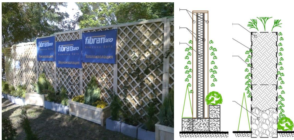
Фиг. 7. Зелена шумозащитна стена: Вариант на екологична шумозащитна, преградно съоръжение „лек и тежък тип“ по научна разработка към ЦНИП при УАСГ на тема „Възможности и ефективност на екологични шумозащитни преградни съоръжения в градски условия“ (гр. София) [18]

Зелените шумозащитни стени са с външен покривен слой от растения върху носеща конструкция, по която да се задържат (фиг. 7). Основните части на една такава стена са фундаменти, надземна конструкция и изолационни пана. Фундаментът е от стоманобетон – монолитен или сглобяем. В някои от вариантите конструкцията му е изцяло вкопана в земята, а в други част от нея продължава в цокъл, с цел отделяне на шумоизолационната стена от влагата. Конструкциите са с разнообразни форми и материали. Най-често прилаганите решения са панели между стоманени носещи колони. Това решение прави шумозащитните стени леки, лесни и бързи за изпълнение.