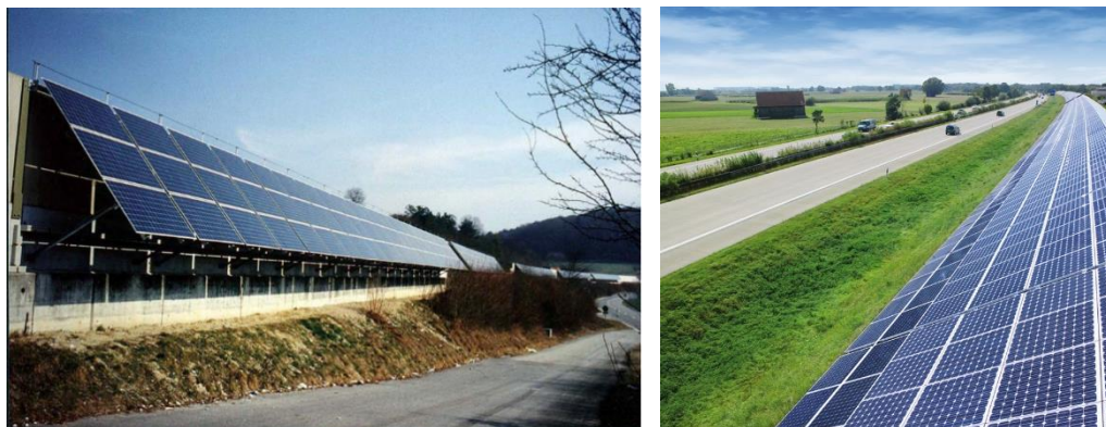
Фиг. 9. ФотоVOLтаични шумозащитни прегради [25, 26]

Примерът показва, че при инсталацията на фотоволтаичен парк, същият може да бъде поставен и обратно, и срещу магистралата. Това означава, че при използването на фотоволтаични компоненти за звукови бариери двупосочно на движението, може да има PV система, ориентирана подходящо към падането на слънчевия лъч и за двете страни на линейното съоръжение (едната обръната към магистралата, а другата на противоположната стена, обръната навън).