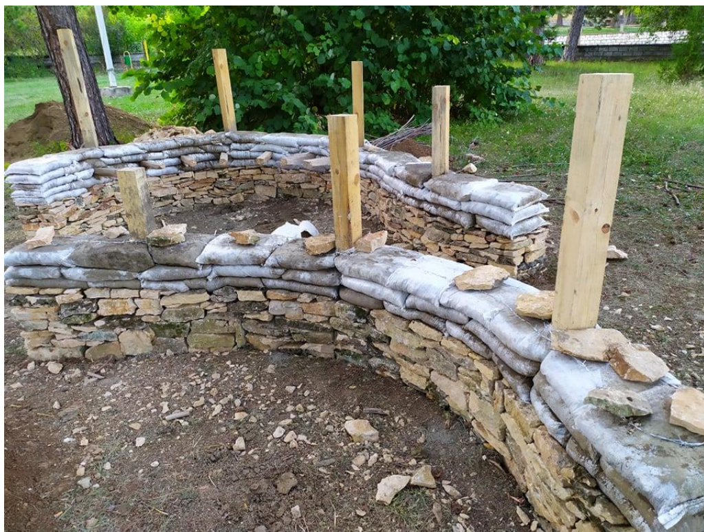
Фиг. 4. Вертикални укрепващи елементи на зидарията (снимка от експерименталната конструкция в с. Кърпачево)

Методът за изграждане представлява технология на трамбована почва, в комбинация с плетени чували, изпълняващи ролята на гъвкав кофраж [4]. Основният процес се състои в изливане на механично раздробена смес от глинеста почва със земновлажна консистенция в чувалите и подреждането им под формата на зидария със застъпване на вертикалните fugи. Положените тела своевременно се уплътняват с помощта на ръчни трамбовъчни чукове (фиг. 3). Между редовете на зидарията двойно опъната стоманена бодлива тел извършва ролята на хоросан чрез механичния контакт между бодлите и почвата. По този начин се осигурява опънна якост и същевременно позволява изграждането на по-сложни форми като куполи, арки, криви стени. Укрепването във вертикален план се постига чрез вложени между телата колони, обикновено дървени (фиг. 4). Стените, изградени от почвени чували, се фундират върху ивични основи, като задължително условие е издигането над прилежащия терен, с цел ограничаване на капиллярната влага. Строителството с този технологичен метод е сравнително бързо за изпълнение, не изисква специализиран труд и механизация и дава възможност за изграждане на конструкции с ниска себестойност и екологичен отпечатък.