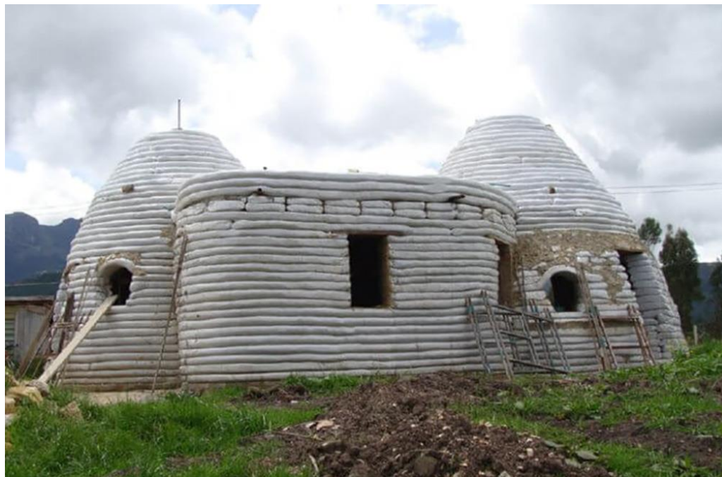
Фиг. 1. Съвременна куполна конструкция от чували, запълнени с почва

Работата започна преди самата практика през месец юли с проектиране на стената. Преосмисляйки традиционни форми и материали от региона и архитектурни примери на конструкции с чували с почва, студентите измислиха няколко варианта на рекреационни стени с пейки, направиха макети от глина и след обсъждане в екипа бе избран вариант, който трябваше да бъде построен. Докторантът оразмери конструкцията, направи рецепта за сместа и количествата необходими материали, които бяха поръчани предварително. Проектното предложение бе подадено в община Летница и получи разрешение, докато строителните материали бяха поръчани от местни доставчици.