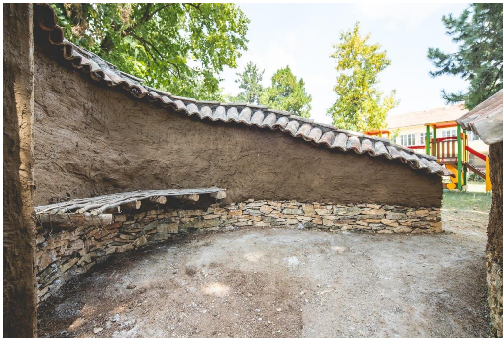
Фиг. 5. Снимка на завършената рекреационна стена в с. Кърпачево

менти от суха каменна зидария, с ширина 30 cm и дължина около 10 m. Сухата каменна зидария е традиционна техника за строителство в региона и за изпълнението ѝ бяха включени местни специализирани работници. Към фундаментите са захванати вертикални дървени елементи 10/10 cm, осигуряващи цялостна устойчивост на стените. Беше експериментирано с два различни начина на анкерирание на вертикалните елементи – директно вграждане в каменната зидария; и чрез използване на тежестта на почвените тела. Основната конструкция е изпълнена от синтетични чували с размери 40/60 cm, запълнени със смес от почва и пясък, добити локално от региона. Зидарията от почвени чували бе изпълнена в променлива височина, съгласно параметрите на проекта. Върху двете тела на рекреационната стена беше изпълнена шапка от стари използвани традиционни керемиди, закупени от рушащи се сгради в самото село. За финал беше изпълнена глинена замазка, за изработването ѝ беше приложен традиционен метод за рециклиране на стари кирпичени тухли, в комбинация с нарязана слама, за ограничаване на пукнатините от съсъхване. Крайният облик на рекреационната стена беше в съответствие с автентично запазените дувари, които са характерни за региона, но в комбинация със съвременни, органични форми и добро вписване в средата на парка, където е разположена.