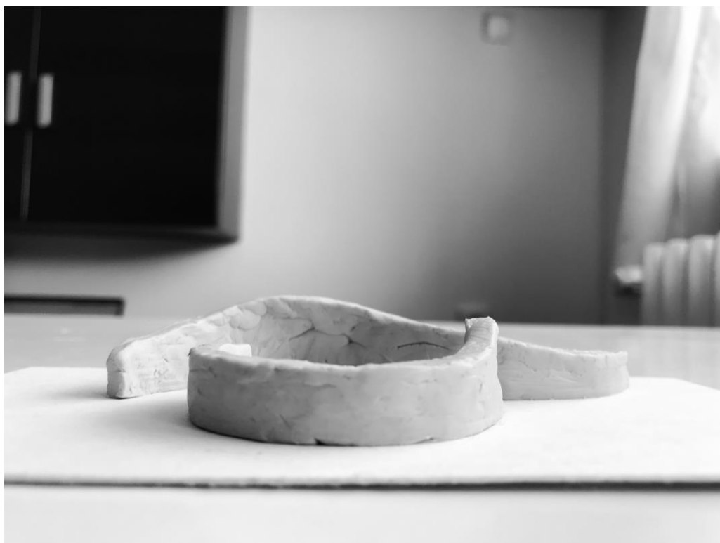
Фиг. 2. Макет на идейния архитектурен проект