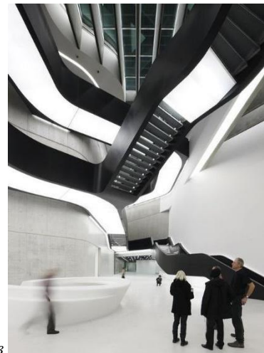
Фиг. 1. Музей МАХХІ в Рим [2]

а – изглед от главния вход; б – план на партерния етаж; в – атриумно пространство [2]