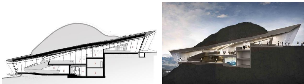
Фиг. 9. Разрез през музейната сграда – организация на вътрешното пространство [9]

Музеят е разположен на няколко нива, а връзката между тях се реализира с поредица от стълби, следващи пътя на посетителите през преливащите се изложбени пространства. Вж. фиг. 9 [9].