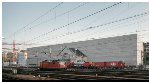
Фиг. 6. Кантонален музей за изящно изкуство в Лозана, Швейцария [8]

Фасадите на монолитния обем на сградата са решени съобразно ориентацията – затворена, плътна, с включения фрагмент от гаровата сграда към релсите и по-отворена, оформена със слънцезащитни пиластри към площадното пространство.