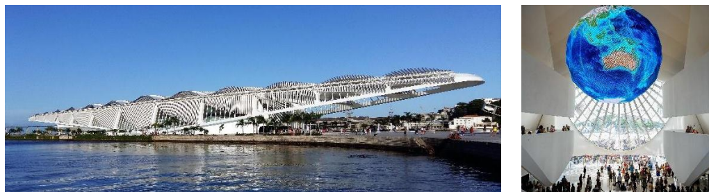
Фиг. 2. Museum of Tomorrow в Рио де Жанейро, Сантяго Калатрава [3]

Като нов градски символ е замислен и реализиран от арх. Сантяго Калатрава и Museum of Tomorrow в Рио де Жанейро, открит през 2015 г.