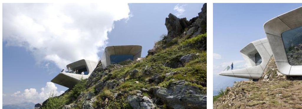
Фиг. 8. Messner Mountain Museum Corones, провинция Болано – южен Тирол, Италия [9]

Трябва да се има предвид, че с включването им в туристическата индустрия и налагащото се присъствие в Интернет, музеите се превръщат в наистина глобален феномен, който налага и появата на термина „glocal“ (съчетание на локален и глобален – „global“ и „local“), който се прилага към музея днес [1].