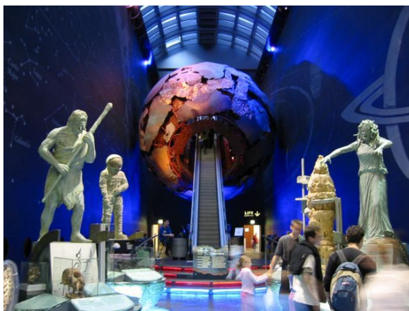
Фиг. 5. Природонаучен музей в Лондон. Вход към „Галерия Земя“, проектирана от арх. Нийл Потър [7]

Виртуалната реалност намира най-широко приложение в научно-образователните музеи за деца. Причината за това може да търсим в спецификата на детската психология, според която възприемчивостта на децата се засилва, когато те са активни участници в образователния процес. Поради тази причина музеи като Природонаучния музей в Лондон са едни от най-посещаваните в света и с голяма детска аудитория. Още от влизането, музеят загатва изследователския подход на експониране. Преходът от фойето към експозицията е чрез ескалатор, който води към вътрешността на огромна сфера, представляваща планетата земя, намираща своето място в космическия интериор на фойето. Вж. фиг. 5. Музейните зали са скрити от очите на посетителя, преди и пътят към тях е символчен – чрез навлизането в недрата на земята и опознаването по емпиричен начин. С тази цел и информацията, която посетителят получава, е представена с механични, физични, химични модели, осъвременени с участието на виртуалната реалност чрез компютърни технологии и програми, 3D-очила, холограмни изображения и др.