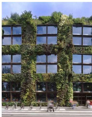
Фиг. 3. Musée du Quai Branly, Париж, арх. Жан Нувел [4]

Друг подход при реконструкция за „отваряне“ на музея към града е използван от архитектите Жан-Марк Ибо и Мирто Витар при реконструкцията на Музея за изящни изкуства във френския град Лил, реализирана през 1998 г. Те не се намесват в архитектурата на строената в края на 19 век сграда, но променят нейното възприятие от страната на града. Това е постигнато чрез издигнатата във входната зона висока стъклена стена, през която визията на старата музейна сграда придобива съвременно звучене. Основната функция на тази прозрачна стена е по-скоро символична – като екран. Сградата сякаш се прожектира върху стената, придобивайки визуалното усещане за виртуален образ. Вж. фиг. 4.