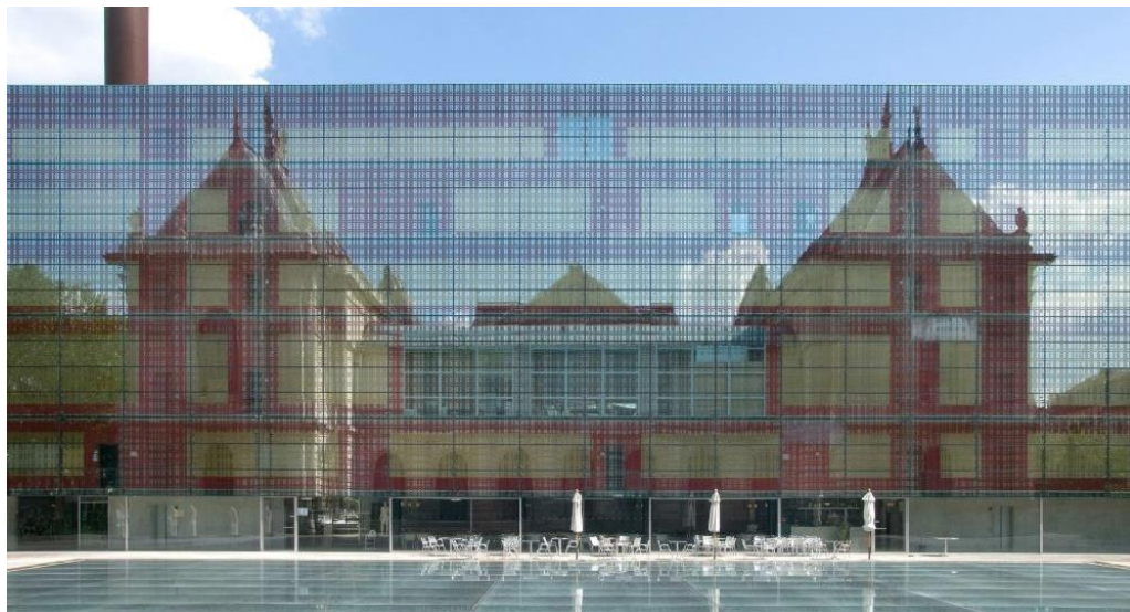
Фиг. 4. Стъклена стена, посрещаща посетителя във входната зона на Музея за изящни изкуства в гр. Лил, Франция [5]

Друг подход при реконструкция за „отваряне“ на музея към града е използван от архитектите Жан-Марк Ибо и Мирто Витар при реконструкцията на Музея за изящни изкуства във френския град Лил, реализирана през 1998 г. Те не се намесват в архитектурата на строената в края на 19 век сграда, но променят нейното възприятие от страната на града. Това е постигнато чрез издигнатата във входната зона висока стъклена стена, през която визията на старата музейна сграда придобива съвременно звучене. Основната функция на тази прозрачна стена е по-скоро символична – като екран. Сградата сякаш се прожектира върху стената, придобивайки визуалното усещане за виртуален образ. Вж. фиг. 4.