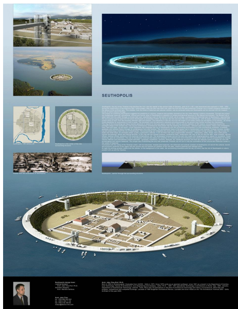
Фиг. 2. Проект: Seuthopolis, автор: проф. арх. Жеко Тилев