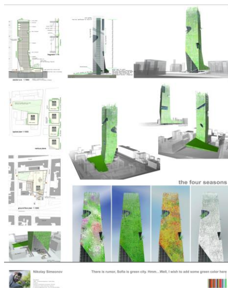
Фиг. 4. Проект: The Four Seasons, автор: арх. Николай Симеонов