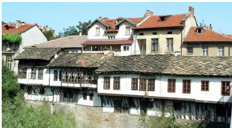
Фиг. 8. Комплекс къщи „Марков мост“