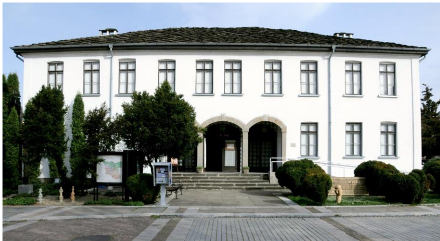
Фиг. 4. Музей на народните художествени занаяти и приложните изкуства

Разположен е на централния градски площад. При построяването си през 1881 г. от Уста Генчо Кънев, сградата е била първата в града след Освобождението, предназначена за училище, в последствие е била използвана за общинското управление и мирово съдилище. От 1964 г. е реконструирана в музей и е обявена за паметник на културата. В резултат на извършените укрепителни и строително-монтажни работи през 60-те години на миналия век е изградено стоманобетонно ядро за укрепване срещу земетръс на оригиналната конструкция от носещи тухлени стени и част от съществуващият гредоред е подменен със стоманобетонни плочи. Запазена е дървената покривна конструкция и покритието от каменни тикли.