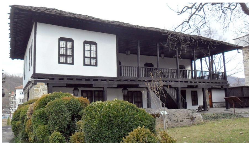
Фиг. 5. Исторически музей – експозиция „Възраждане“