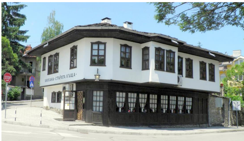
Фиг. 6. Механа „Старата къща“

Сградата е обявена за недвижимо културно наследство от местно значение.