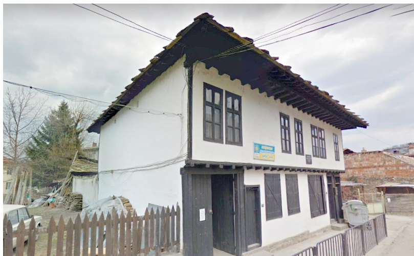
Фиг. 7. Шошковата къща

Сградата е обявена за недвижимо културно наследство от местно значение. Известна е като къща на троянския художник Иван Шошков. Двуетажната сграда е типичен пример за възрожденска къща от района на Централен Балкан. Построена в края на 18 век като жилищна сграда с характерната функционална схема – първия етаж за производствени и търговски нужди, а втория за жилищни. В момента сградата се използва за Общинския педагогически център.