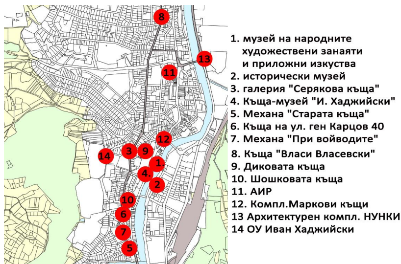
Фиг. 3. Знакови сгради в централната зона, част от архитектурното наследство на града

В района на гр. Троян има няколко обекта, класифицирани като „недвижимо културно наследство от национално значение” (според Данни от Националния публичен регистър на недвижимите културни ценности на НИИКН):