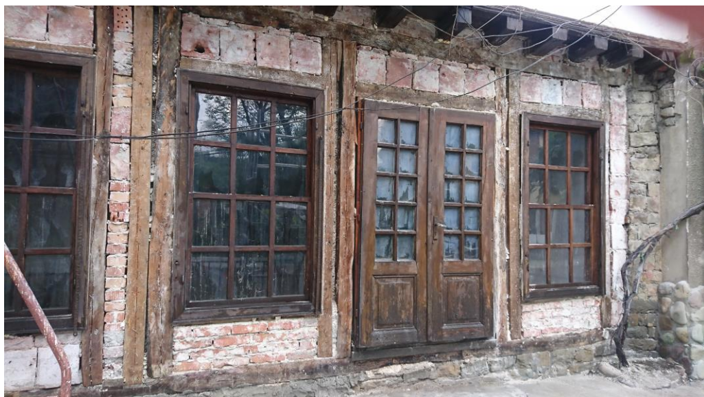
Фиг. 9. Механа „При войводите“ – съществуващо състояние

Сградата е обявена за недвижимо културно наследство от местно значение.