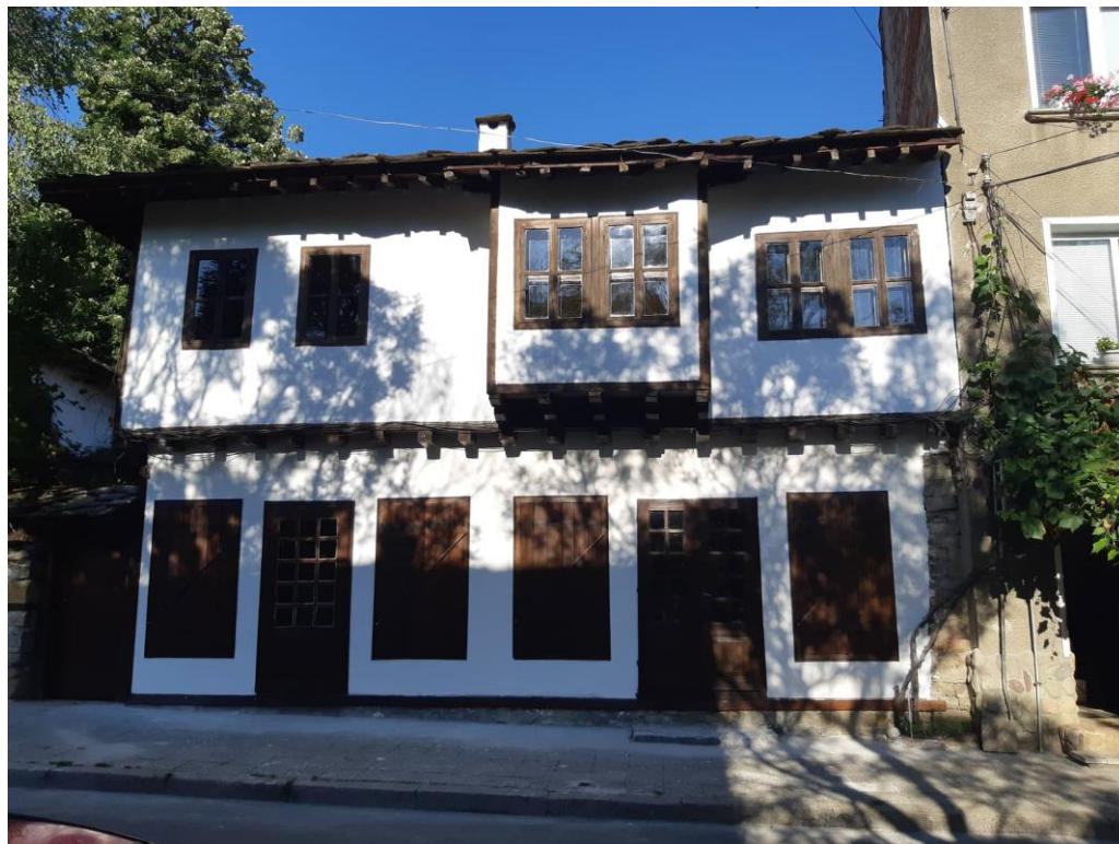
Фиг. 10. Механа „При войводите“ – след студентската практика

В резултат на студентска преддипломна практика през м. юли 2019 г. е възстановена структурата на оградящите стени на главната фасада и са извършени възстановителни дейности по каменната зидария на приземно ниво. Под ръководството на майстор-дърводелец са възстановени компрометираните елементи от дървената стълба и няколко дървени хоризонтални греди (сантрачи) в структурата на каменната зидария.