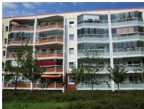
Фиг. 5. Варианти на оформление на лоджиите при саниране на сградите