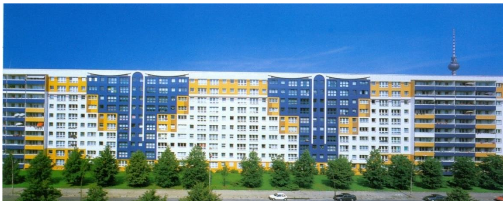
Фиг. 6. Подчертаване на отделните секции чрез цвятово разчленяване по хоризонтала и вертикала

Санирането на жилищните блокове позволява и разчленяването на дългите хоризонтални фасади, при което оптически се редуцира мащабът и се подчертават съставлящите секции. Тази операция се извършва чрез полагане на мазилки в различна цвятова гама по предварително изготвени архитектурни проекти, които осигуряват композиционна цялостност и естетическо въздействие. Могат да бъдат подчертани различни елементи от сградата като се имитират скатни покриви или различни елементи от постмодерната архитектура: пиластри, фронтони, козирки, рамкиране на прозорци, дори дориране на фасадата на отвори и техните обитатели.