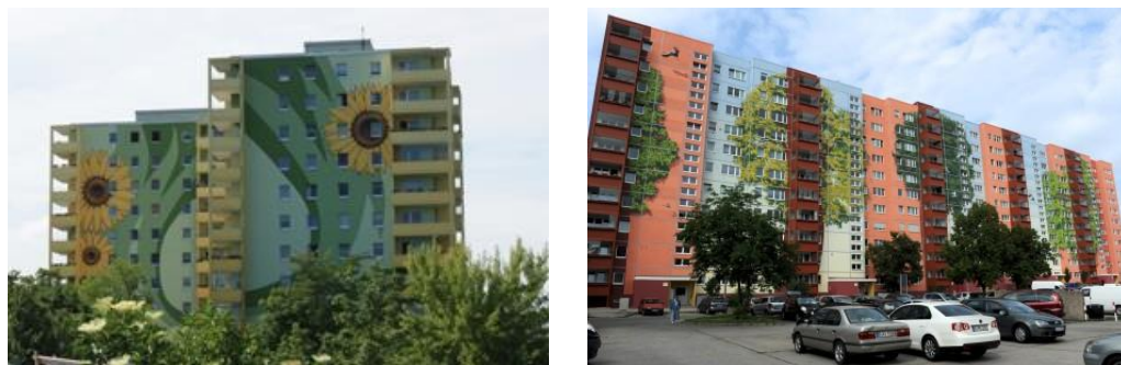
Фиг. 8. Изобразително изкуство по фасадите – акцентирание в пространството

При санирането фасадите могат да бъдат обект и на изобразителното изкуство, което се прилага преди всичко при по-високите сгради с благоприятна видимост на изображенията. Целта е постигане на по-човешки мащаб, топлота и уникалност на конкретните обекти, които се превръщат в акценти на средата за обитаване.