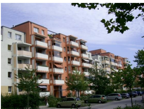
Фиг. 11. Отнемане на етажи от панелни блокове в жилищен комплекс „Марцан“

Отнемането на етажи и секции от панелните сгради се извършва по две причини. Първата от тях е високата амортизация на сградата, а втората – желанието да се разчупят прекалено дългите и монотонни редици от еднообразни сгради и получаване на поразчупен силует, тангиращ комуникационните артерии. Тези преобразования са възможни само когато жилищата не са частна собственост, а принадлежат на стопанисващата ги жилищно-строителна кооперация. По този начин е възможно да се получи и типология от по-ниски апартаментни сгради, които се доближават до параметрите на еднофамилна-