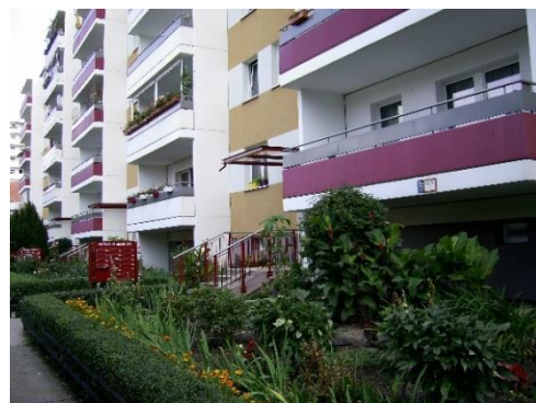
Фиг. 12. Благоустройство на прилежащите пространства