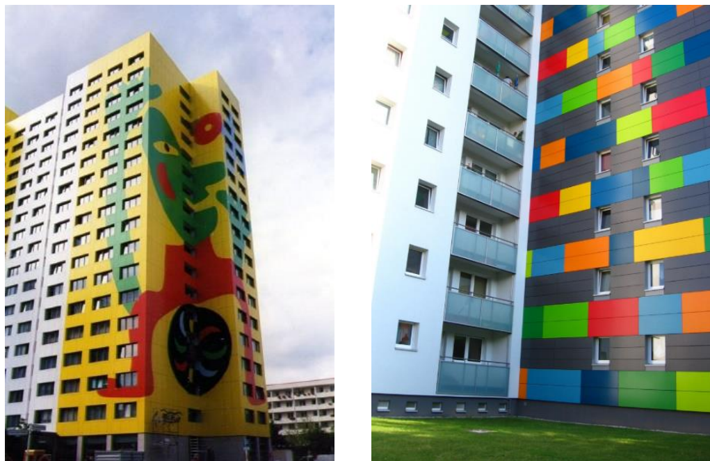
Фиг. 9. Синтез на изобразителното изкуство с архитектурата

Често използван подход е и колористиката – въвеждането на цвят при санирането, особено подходящ за разнообразяване на продълговатите плоски фасади с прозрачни отвори. В тези случаи освен познатите мазилки се използват и италбондови елементи като художественото третиране задължително е по архитектурен проект.