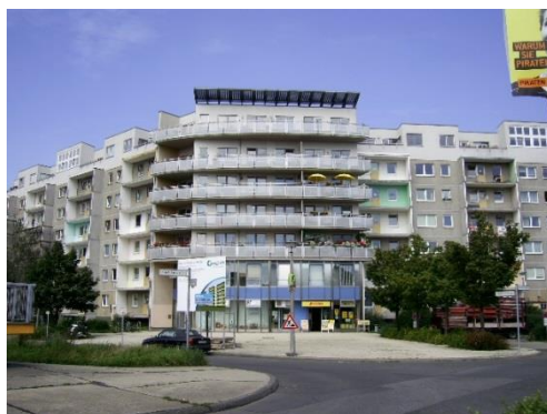
Фиг. 10. Дострояване и надстрояване в панелните комплекси