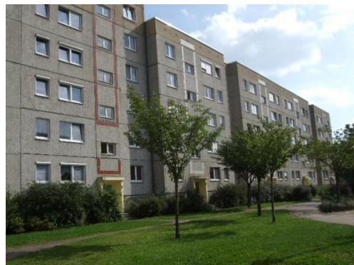
Фиг. 1. Панелните хоризонтални блокове преди санирането