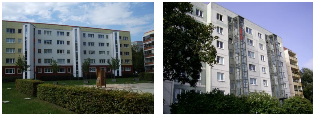
Фиг. 3. Прикрепване на асансьорните клетки към фасадите на панелните блокове

В периода до 1989 година посочените панелни сгради в Източен Берлин са изградени без асансьорни клетки, което затруднява ползването на жилищата от възрастни хора и семейства с малки деца. При санирането се предприема добавяне на нови асансьорни клетки към входните фасади на сградите, които от една страна повишават качеството на обитаване, а от друга – допринасят за разнообразяване и разчленяване на монотонните хоризонтални фасади на блоковете. Използват се както метални остъклени конструкции, така и монолитни обеми, долепени или под ъгъл към фасадите.