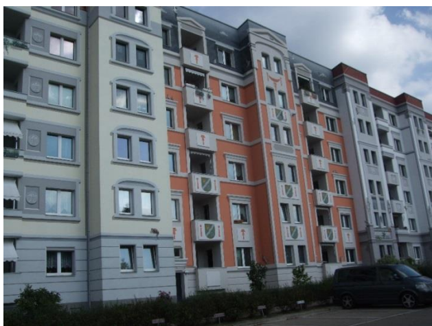
Фиг. 7. Разчленяване на фасадите в различни стилове чрез използване на цвятни мазилки и декоративни елементи