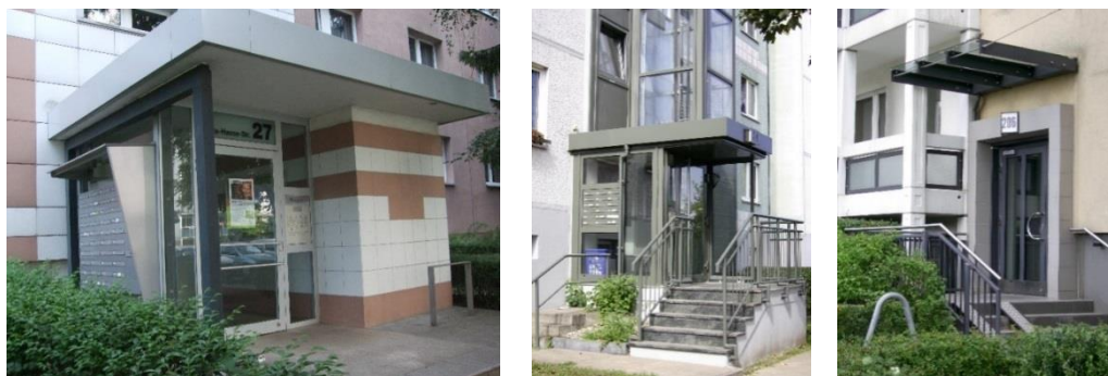
Фиг. 2. Обновени входни пространства в различни панелни сгради