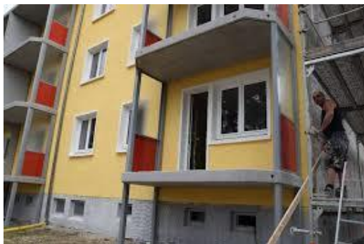
Фиг. 4. а) Номенклатура на индустриално изготвени лоджии за саниране на панелни сгради; б) Монтиране на нови лоджии към жилищата

Логично е към индустриално изградените сгради да се предложи номенклатура от съвместими, индустриално изготвени фасадни елементи. За да се избегне критикувания шаблон и еднообразие, новите елементи се изпълняват с различни материали, конфигурации и цветови решения. Възможни са и остъклявания на новите лоджии. Операциите по санирането се извършват на основата на архитектурни проекти, които не нарушават цялостното въздействие на сградите и пречат всякакви лични инициативи за саниране на парче с ефект на пачуърк.