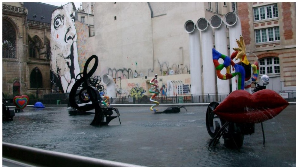
Фиг. 15. Културен център „Жорж Помпиду“, Париж. Жизнерадостните цветове подчертават игривите и веселите форми, както и създават общност с изграждащите специфични елементи на сградата Помпиду. Цветът спомага за тяхното общо композиционно цяло

Цветът може да разчлени и да създаде илюзията за различие между две еднакви тела и форми, както и обратното – да създаде еднаквост или общност между две напълно чужди. Еднаквата им наситеност също ги обединява, като подходящ пример са редиците от жилищно застрояване на един от най-впечатляващите острови – Бурано.