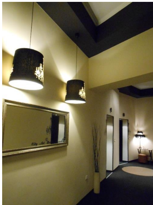
Фиг. 9. Интериор на City Art Boutique Hotel, Пусе. Висящите осветителни тела (по този начин намаляващи височината от тях до пода), които са и с едър размер, едрите шарки, тъмните цветове, между които има контраст, и оцветеният в тъмно под и елементи на тавана оптически намаляват голямата етажна височина

Цветът въздейства и върху мащаба и големината на пространството. Колкото цветът се доближава до белия, толкова повече оптически уголемява пространството, и обратното. От друга страна, по-дребните изображения (повтаряеми или не), по-дребният растер по стените създават същия ефект спрямо по-големите, т.е. действат в обратна зависимост. Яркия цвят също смалява пространството – яркият оранжево-червен цвят може оптически да „смали“ двуетажното пространство на мезонета, да „намали“ двуетажната височина, както и да създаде топлина и уют в по-високата дневна.