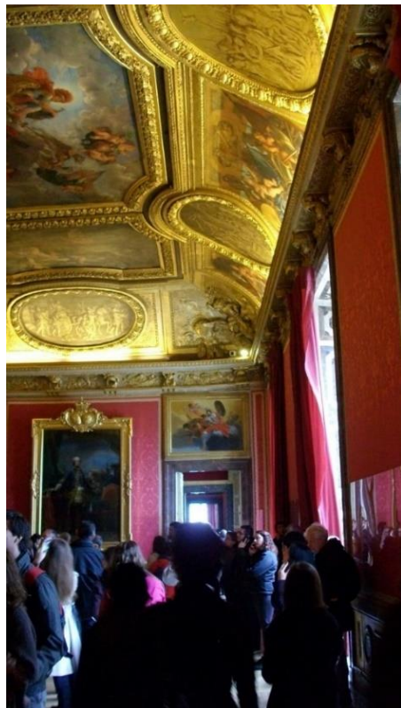
Фиг. 7 и фиг. 8. Интериори във Версай. Цветът изцяло изпълва интериора, но подчертава интериорното решение, форми, обемни, пропорции, членение, като участва във формирането и на акцент в пространството

Светлината и цветът са в синтез с пищния интериор на повечето сгради, представители на сакралната архитектура. Скулптурната форма следва архитектурната, живописата е продължение на скулптурата и я обогатява. Цветът е неизменен композиционен елемент и на плътта, и на отворите.