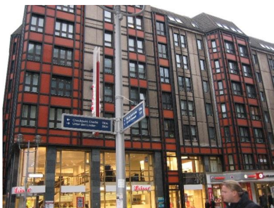
Фиг. 13 и фиг. 14. Сгради със смесени функции, Берлин. Фиг. 13. Разликата в цвета нарушава монотонността и еднаквостта. Фиг. 14. Цветът създава ритмичност и членение в огромната маса, в която има тенденция да има монотонност. За това спомага и употребата на яркия цвят, тъй като създава жизнерадостно и ведро нстрояние

Цветът може да разчлени и да създаде илюзията за различие между две еднакви тела и форми, както и обратното – да създаде еднаквост или общност между две напълно чужди. Еднаквата им наситеност също ги обединява, като подходящ пример са редиците от жилищно застрояване на един от най-впечатляващите острови – Бурано.