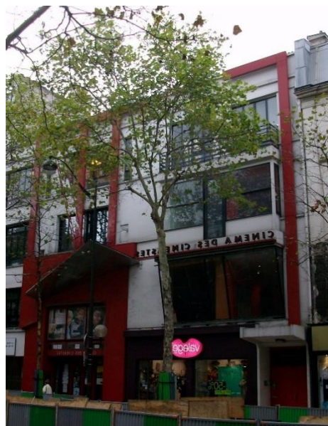
Фиг. 3. Жилищна сграда в Берлин. Яркият цвят подчертава и обобщава специфичната цялостна форма. Фиг. 4. Обществена сграда в Париж. Наситено-червеният цвят отличава като, подчертава определени елементи на фасадата и ги прави естетически и обвързани с художествения образ. Цветът участва във формиране на входното пространство, което обемно-пространствено не е добре изявено. В случая цветът спомага и е основен за формиране на външния облик