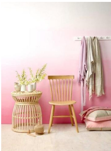
Фиг. 10. Омбре в интериора. Тук цветът е базов за усещането за тектоничност, лекота, объркване или продължение на композицията. Изсветляването на цвета отдолу-нагоре създава категорично чувството за олекотяване, докато изсветляването в обратна посока – е в разрез с вътрешното усещане и убеденост за тектоника, опора и устойчивост. Подобен илюзорен принцип за олекотяване на фасадата се използва при плочовидните сгради, високи и дълги, въздействащи негативно в градоустройствения ареал