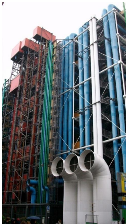
Фиг. 11. Жилищна сграда в Париж. Цветът участва в контрастното съпоставяне и делене между сградите в редицата. Фиг. 12. Културен център „ЖоржПомпиду“, Париж. Цветът активно подчертава участието на елементите, именно които са в основата на нестандартното решение