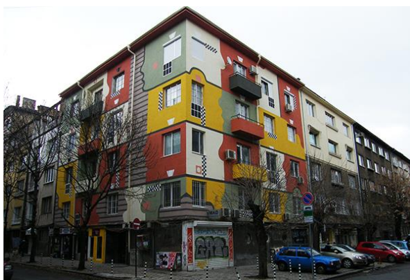
Фиг. 5. Изображение на часовник в коридора на City Art Boutique Hotel в Русе. Цветът създава илюзията за несъществуващ образ. Фиг. 6. Жилищна сграда в София. Цветовото изграждане, комбинирано с неправилни геометрични линии (кривини) и липсата на конкретизация по отношение на редуването са в сполучлив разрез спрямо първичната подредба и стандартен вид на сградата. Тук цветовата композиция, имаща свой собствен характер, който е в противовес на архитектурните форми и принципи, прави сполучлив акцент при ъгловото застрояване