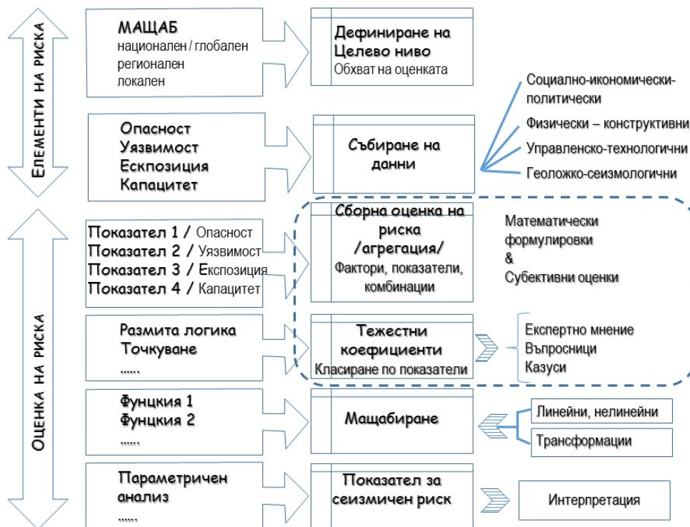
Фиг. 2. Авторска схема на холистична процедура за оценка на сеизмичен риск [4]