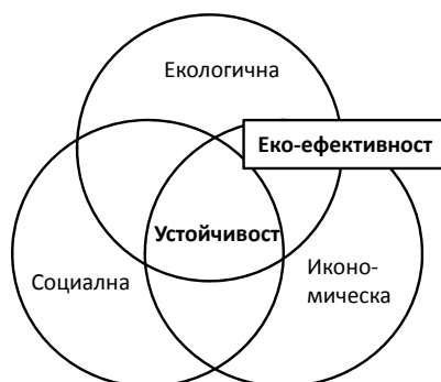
Фиг. 1. Сфери на устойчивото развитие

[21]. Концепцията за екоефективност се появява в резултат на търсенето на начин за изразяване едновременно на екологичното и икономическото представяне на една система и тяхната взаимовръзка. Най-често срещаната кратка дефиниция е „Да правим повече с по-малко“ или да произвеждаме повече с по-малко отрицателно въздействие върху околната среда, измерено като редуцирани емисии и намалена консумация на суровини от природата [20]. Общоприетото формално определение е на WBCSD и гласи, че екоефективността се постига с доставянето на продукти и услуги на конкурентни цени, които задоволяват човешките нужди и осигуряват качество на живот, като същевременно прогресивно се намалява екологичното въздействие и интензивността на използване на ресурсите през целия жизнен цикъл до ниво поне съответстващо на допустимия капацитет на Земята [26].