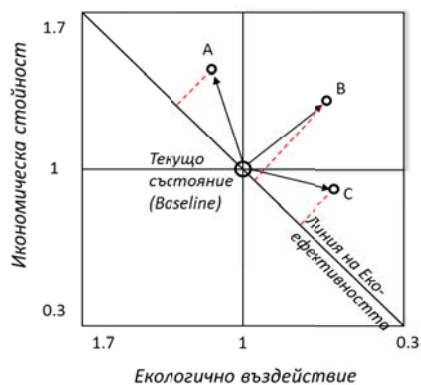
Фиг. 3. Графична визуализация на екоефективността на сравняваните алтернативи [20]