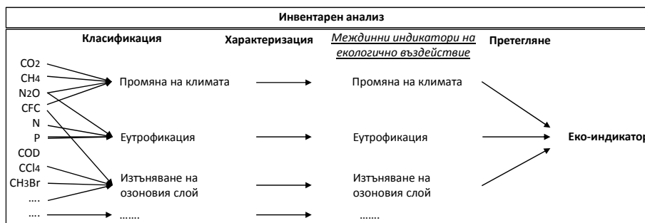
Фиг. 5. Инвентарен анализ в LCA

Оценката на жизнения цикъл (LCA) се състои от четири последователни стъпки: 1) дефиниране на целта, обхвата и сферата на приложение; 2) инвентарен анализ на входящите и изходящите потоци; 3) оценка на екологичното въздействие; 4) интерпретация на резултатите.