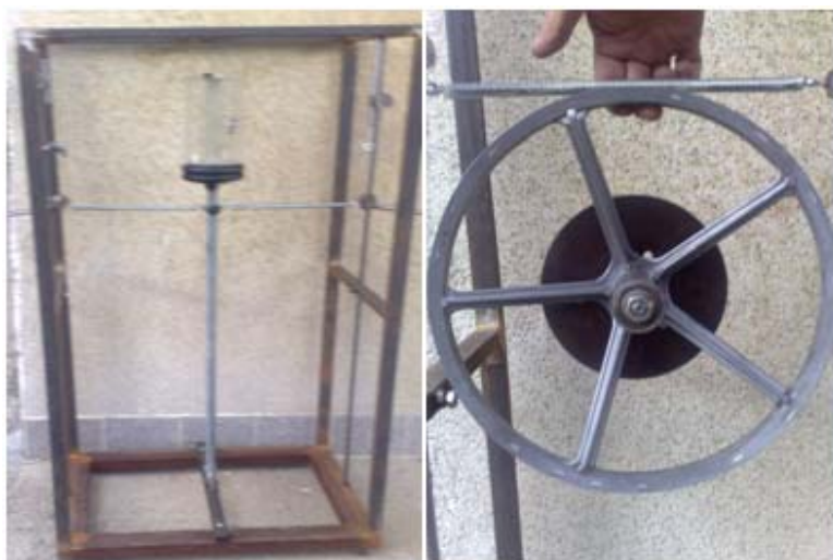
Фиг. 2. Стенд за изследване ъгловите трептения на тяло във вертикалната равнина – общ вид

Общият вид на стенда със и без редуктор за симулиране на кинематични смущения може да се види на фиг. 2.