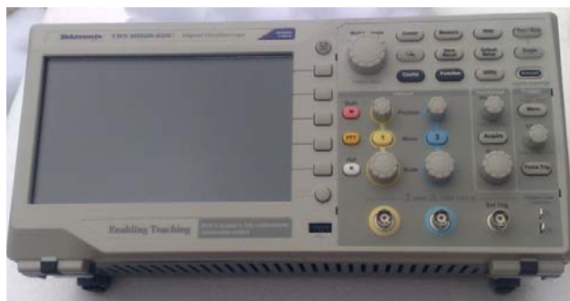
Фиг. 8. Осцилоскоп Tektronix TBS1052B-EDU за обработка на електрическия сигнал

Датчикът отчита завъртания от -180 до 180^\circ . На база завъртането предава електрически сигнал по кабел към осцилоскоп с големина на тока от -10 до 10 V.