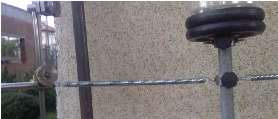
Фиг. 5. Еластични комплекти за поддържане на трептенето на тялото

(когато прътът е вертикален) са ненапрегнати. Пружините обаче, които масово се произвеждат, са или пружини на натиск, или пружини на опън, на които ненапрегнатото им състояние е абсолютно свито. Т.е. едните не могат да работят на опън, а другите на натиск. За целта трябва да се търсят комбинирани пружини, които в България не се произвеждат. Освен това в ненапрегнато състояние пружината, която е хоризонтална, може и да провисне. Затова бяха закупени двойки пружини на опън, които в положението на вертикален прът са опънати еднакво. След това те работят като последователно свързани пружини с тяло между тях. Общата коравина на еквивалентната пружина е сумата от коравината на двете пружини от двете страни на пръта. Стендът разполага с няколко такива двойки пружини – с коравина 80, 120, 160 и 200 N/m – фиг. 5.