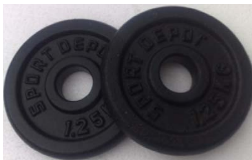
Фиг. 4. Тежести за моделиране на концентрирани маси по височината на прътите

Концентрираните маси, които се разполагат по височината на пръта са дискове за вдигане на тежести. На този етап са закупени 6 диска с тегло 1,25 kg – фиг. 4. Дисковете са с отвор 30 mm и директно се закрепят за тръбата 1". За другите два вида тръби са произведени по 3 втулки за неподвижно закрепяне на дисковете към по-малките тръби.