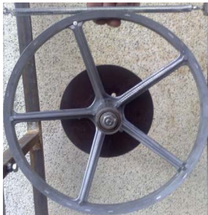
Фиг. 6. Редуктор за симулиране на кинематични смущения

За демпфер на този етап се ползва демпферът от първия стенд [1], който е мобилен и лесно може да се премества от стенд на стенд.