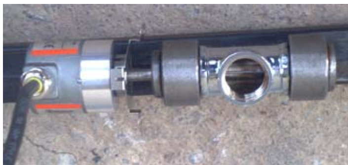
Фиг. 7. Датчик за ъглови измервания Cubler D8.3A1.0025.A221

Измерването на вибрациите освен визуално върху ъглова скала се осигурява и електронно. За целта към лагера, към който се захващат прътите е закрепен датчик за ъглови измервания D8.3A1.0025.A221.0000 на фирма Cubler, закупен от фирма Сензомат ООД, България – фиг. 7.