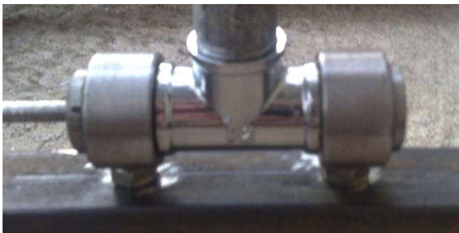
Фиг. 3. Лагер за връзка на тялото с корпуса на стенда

Интересно е решението на лагера, който свързва тръбите с корпуса на стенда (фиг. 4). Тъй като тръбите са водопроводни, съответният елемент от лагера, където влиза тръбата, е тройни 1/2". За другите тръби (3/4 и 1 ") се ползва малък преходник към другите цолажи, които също са налични във всеки железарски магазин. Другите два отвора на тройника са свързани чрез ос с лагери и датчика за ъглово измерване.