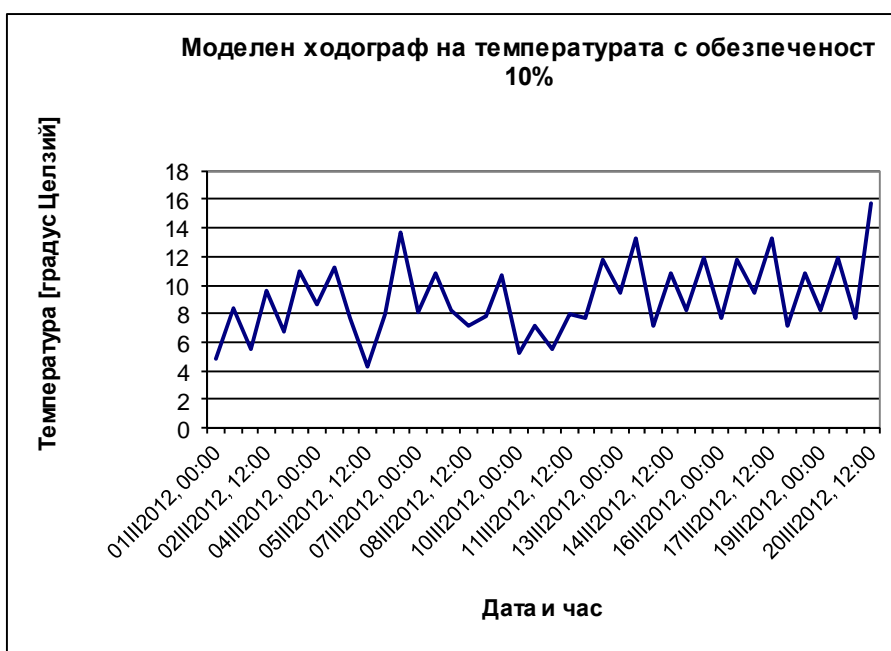
Фиг. 2. Моделен ходограф на температурата с обезпеченост 10%