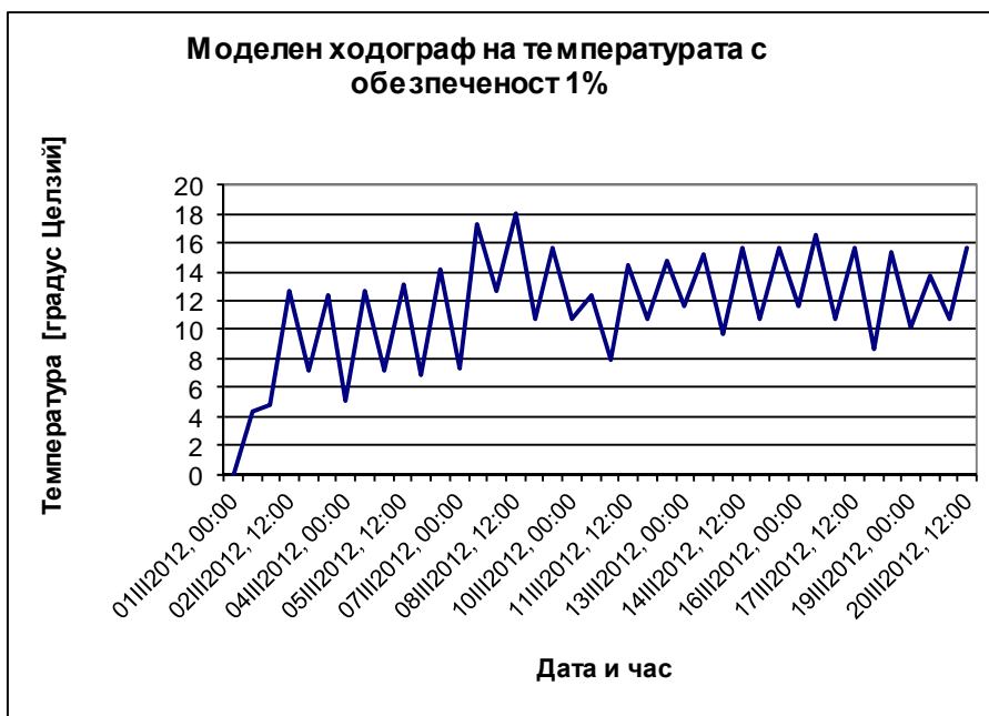
Фиг. 1. Моделен ходограф на температурата с обезпеченост 1%